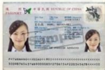
有效期限內護照正本